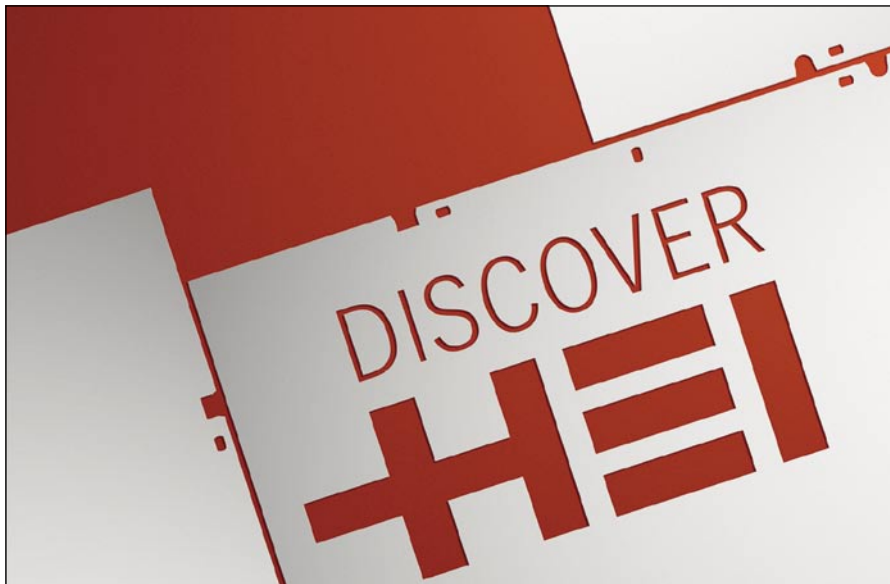
Der drupa-Messeauftritt von Heidelberg in Halle 1 steht unter dem Leitmotto „Discover HEI“.

sentiert Heidelberg auf der drupa das eigene Leistungsangebot mit einem direkten Bezug zu den wichtigsten Markttrends in der Druckindustrie. „Wir sehen die drupa als Chance für unsere Branche, sich für die Herausforderungen der Zukunft richtig aufzustellen. Unsere Aufgabe wird daher sein, den Kunden zu demonstrieren, dass gedruckte Kommunikation heute und auch morgen Zukunft hat“, ist sich Schreier sicher. „Es gibt Wachstumsmöglichkeiten, aber Wachstum kommt nicht von alleine, weil sich das Umfeld zunehmend fragmentiert. Und dies geschieht regional und international, aber auch in den existierenden Marktsegmenten. Wer seinen Kunden in Zukunft mehr bieten will, braucht vor allem betriebswirtschaftlich optimierte Prozesse und innovative Geschäftsmodelle.“