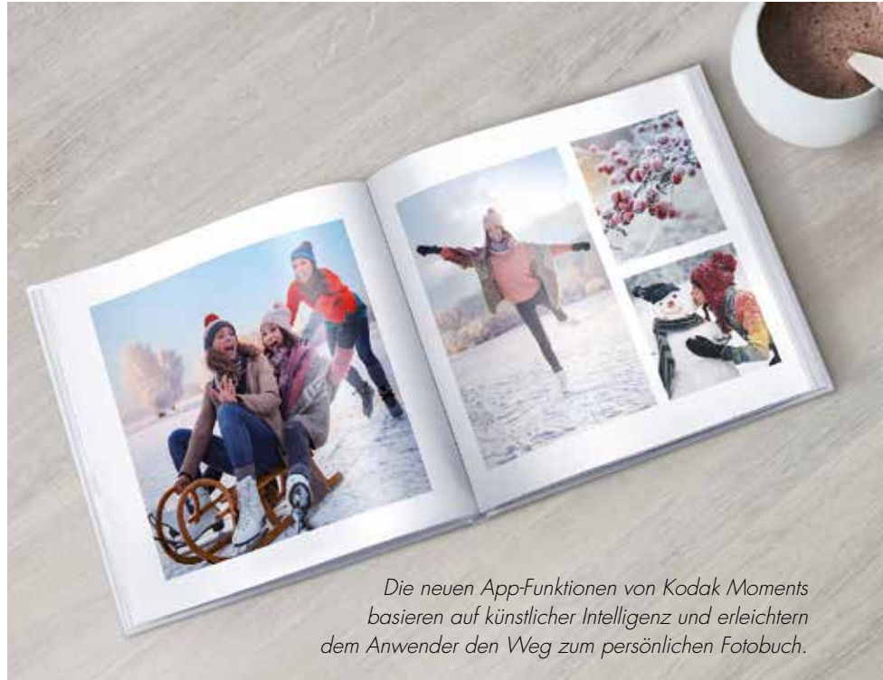
Die neuen App-Funktionen von Kodak Moments basieren auf künstlicher Intelligenz und erleichtern dem Anwender den Weg zum persönlichen Fotobuch.

Mit den neuen, smarten Features Moments Finder und Story Maker hat Kodak Moments rechtzeitig zum Weihnachtsgeschäft seine Kodak Moments App aufgerüstet, um es den Anwendern mit Hilfe von künstlicher Intelligenz (KI) deutlich einfacher zu machen, ihre wichtigsten Bilder zu finden und damit Bildprodukte und Fotobücher zu gestalten. Die Kombination der legendären Fotokompetenz von Kodak Moments mit neuen Technologien soll auch Impulse für das Geschäft mit Fotobüchern im Fotohandel geben.