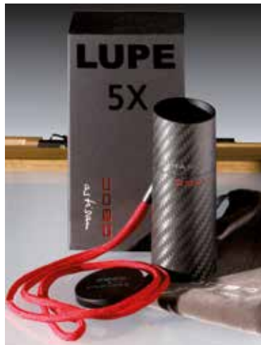
Die neue Einstell-Lupe erlaubt präzises Fokussieren auf der Mattscheibe.

Für enorme Steifigkeit sorgt die dünne Bodenplatte aus Teakholz, die auf beiden Seiten mit einer dünnen Carbonschicht gegen Torsion geschützt wird. Auch ein Großteil der Standarten ist aus Carbon gefertigt. Die hintere Standarte der Alpinist 810X lässt sich um 30 Grad tilten. Noch großzügiger als bei der klassischen Alpinist kann die vordere Standarte: Vertikales Shiften ist nach oben um 87 mm, nach unten um 75 mm möglich, horizontales Shiften um 50 mm in jede Richtung. Das