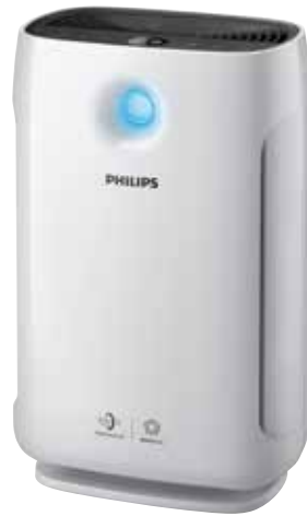
Saubere Luft ist so wichtig wie nie. Luftreiniger wie die 2000er Serie von Philips können mit Hepa-Filtern 99,97 Prozent der Partikel aus der Luft entfernen, die durch den Filter strömt. Dabei entfernen sie sogar Partikel, die mit einer Größe von 0,003µm kleiner sind als das kleinste bekannte Virus.

fen inzwischen bewusster ein und entscheiden sich öfter für nachhaltigere Lebensmittel. Die verbleibenden 20 Prozent geben an, dass sie schon vor den aktuellen Diskussionen Wert auf nachhaltige Lebensmittel gelegt haben.