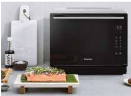
Selber Kochen liegt im Trend. Mit Kombi-Geräten wie dem 4 in 1 Dampfgar-Ofen von Panasonic, der Dampfgarer, Heißluftofen, Inverter-Mikrowelle und Grillfunktion in einem Gehäuse vereint, kann man auch auf wenig Raum gesunde Gerichte zubereiten.

Der Trend zum selber Kochen könnte auch dazu führen, dass mehr Menschen darüber nachdenken, was auf dem Teller landet. Zwar sagt die knappe Hälfte (47 Prozent) der Befragten, dass sie trotz der Debatten um Tierwohl, Herstellungsbedingungen, Ressourcenverbrauch und Klimawandel in den vergangenen zwei Jahren keine wesentlichen Änderungen an ihrem Einkaufsverhalten vorgenommen hat, aber immerhin ein Drittel (33 Prozent) kau-